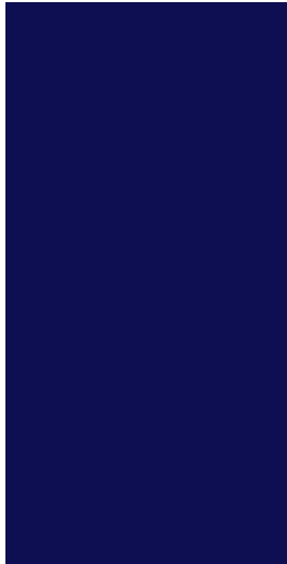
Midnight Blue #0E0E52