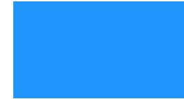
Dodger blue #1E96FC